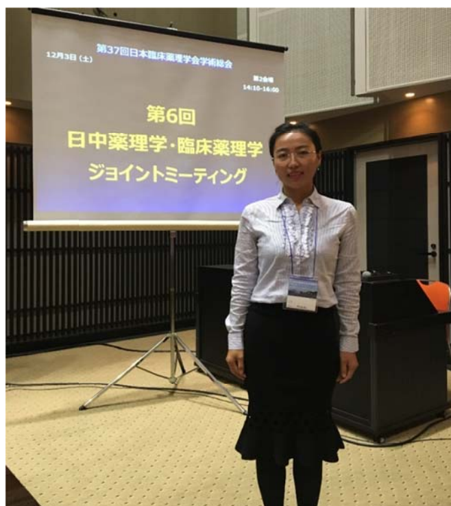
(首都医科大学附属北京朝阳医院 杜萍 供稿)