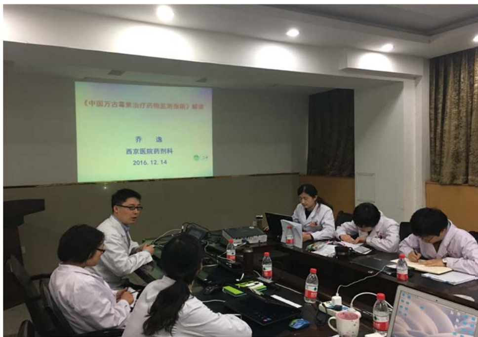
(西京医院药学部 乔逸供稿)